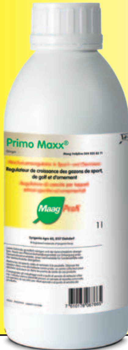
Primo Maxx® 11 Wirkstoff Trinexapac-ethyl.

Maag ist der führende Schweizer Hersteller innovativer Pflanzenpflege-Produkte. Mit einem kompletten Sortiment sowie einem kostenlosen Beratungsservice sorgt Maag umfassend für das Wohl von Pflanzen und Kulturen. Maag blickt auf eine 150-jährige Tradition zurück, ein einmaliger Erfahrungsschatz für Schweizer Pflanzenliebhaber.